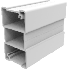
Aluminiowy profil poręczowy